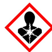
«Опасность для здоровья человека» [10].